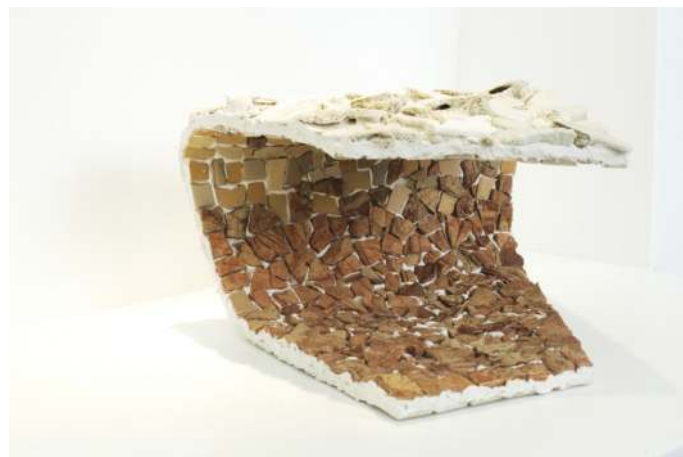
En haut à gauche Vania Carvalho, Wave , 14 x 19 x 22 cm