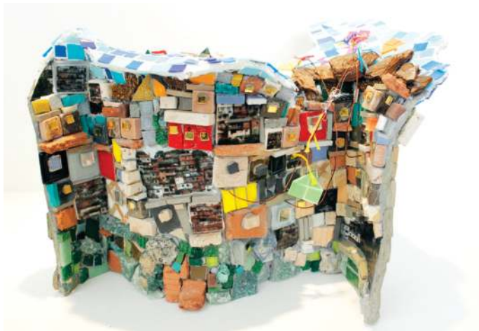
A gauche Cris Piloto Visit to Rio #4 20 x 31 x 20 cm