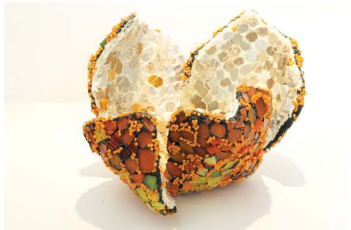
A droite Marise Piloto Balya 24 x 21 x 18 cm