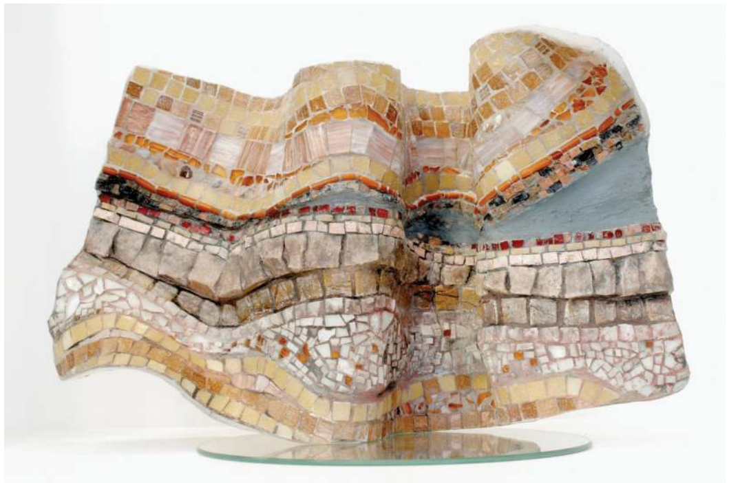
Moema Branquinho Paysage en mouvement 25 x 36 x 16 cm